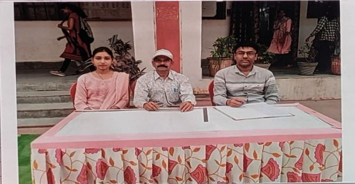
Health check up camp

Champa, Chhattisgarh, India 21VR+XV8, Champa Basti, Champa, Chhattisgarh 495671, India Lat 22.045436° Long 82.641622° 16/02/24 12:57 PM GMT +05:30